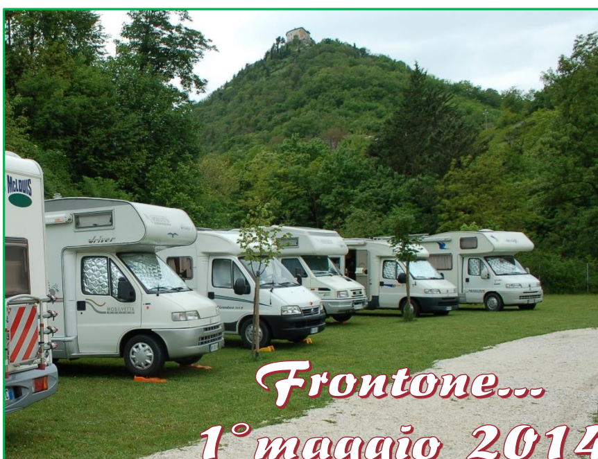
Frontone... 1° maggio 2014