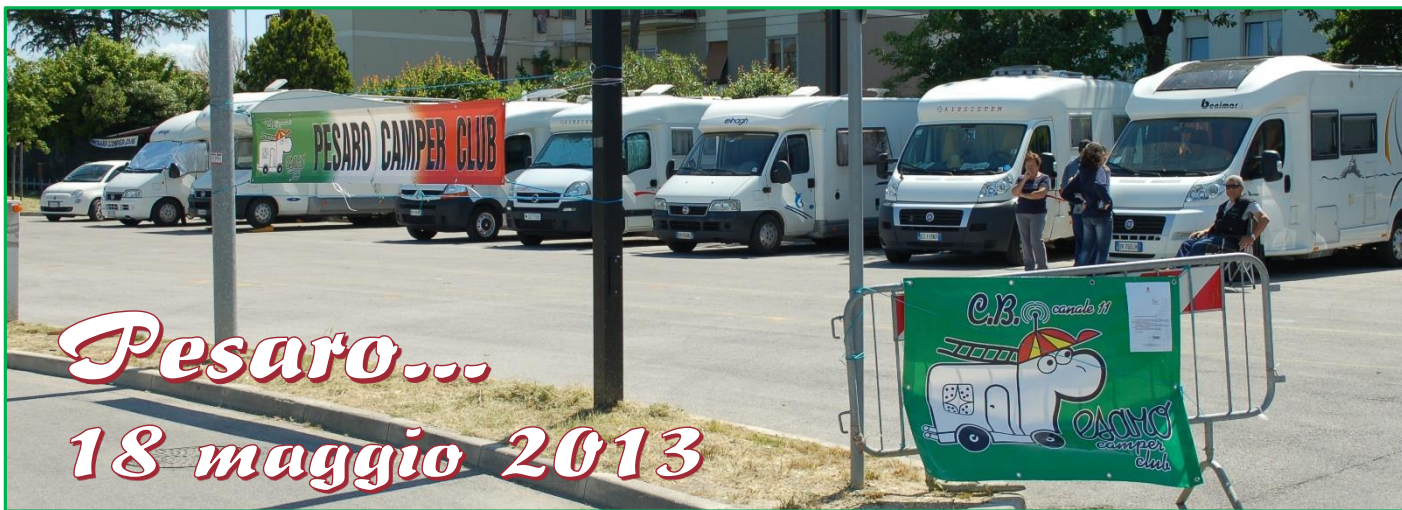
Pesaro... 18 maggio 2013