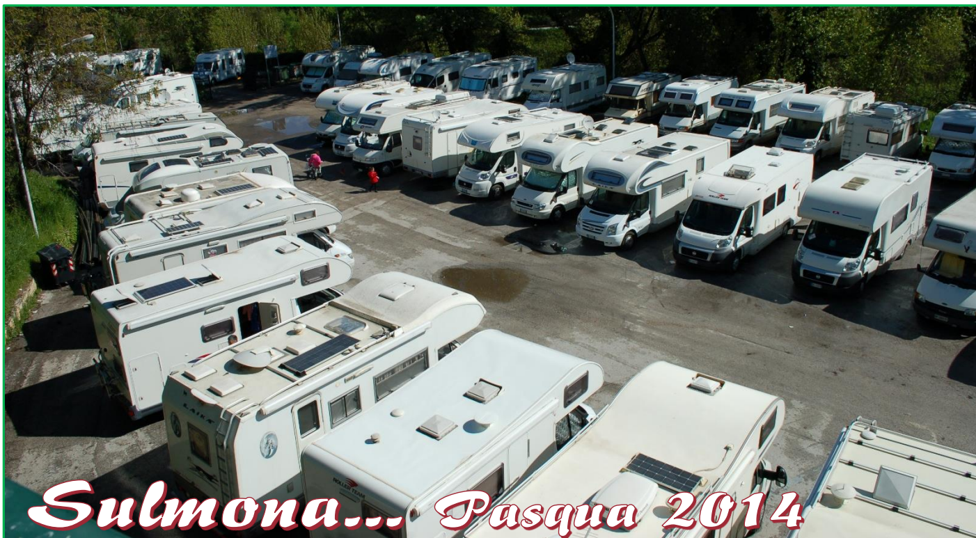
Sulmona... Pasqua 2014